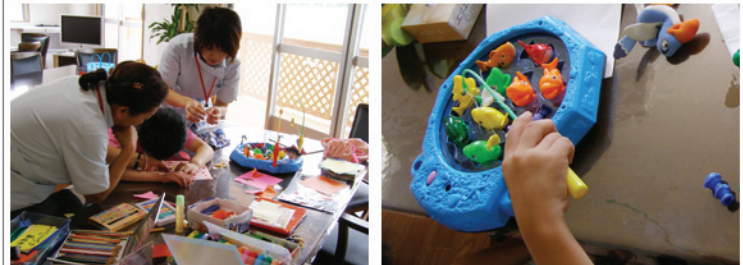
▲色んな遊びを体験

バイキング形式により「食べたい料理を自分で選ぶ」という意志・選択、そして運ぶ・食べる事で普段の食事をより楽しみます。食べる事も機能訓練のひとつです。