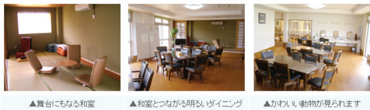
▲舞台にもなる和室