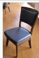
↑カーソルを合わせて見て!