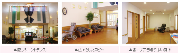
▲癒しのエントランス